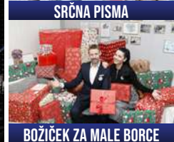
BOŽIČEK ZA MALE BORCE