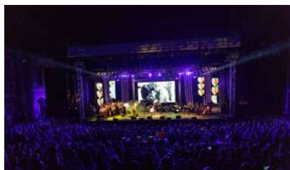
VELIKI DOBRODELNI KONCERT VILJEM JULIJAN